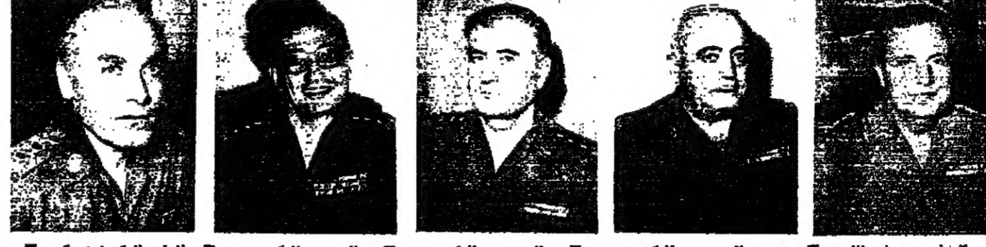
العميد سميد نصرالله ، العميد الركن موصي كنعان ، العميد الركن فرنسيس جباري ، العميد الركن موصي كنعان ، العميد الركن موصي كنعان ، العميد الركن موصي كنعان ، العميد الركن موصي كنعان